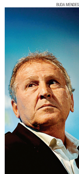
► Zico oficializou candidatura à presidência da Fifa

“Quem conhece minha história de vida não se surpreende.