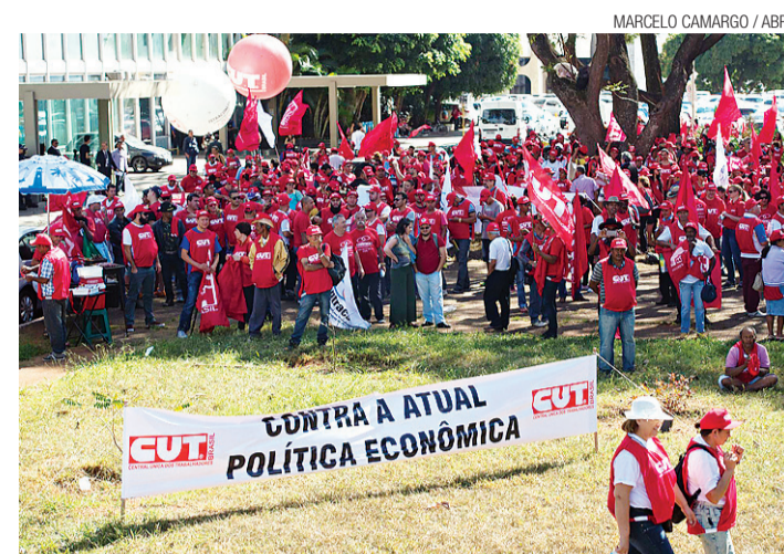
▶ Sustentação do governo, CUT fez protesto contra a condução econômica

"Desde 23 de março de 2015, quando reafirmamos pela última vez os ratings do Brasil, os riscos de rebaixamento aumentaram. Alteramos a perspectiva para 'negativa', pois, apesar das amplas alterações nas políticas em curso, as quais acreditamos continuam recebendo o suporte da presidente, os riscos de execução aumentaram. Tais riscos têm suas origens tanto no front político quanto no econômico", afirma comunicado da S&P.