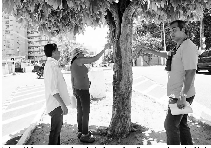
▶ Inventário começou pelos principais e mais antigos corredores da cidade

A meta agora é para toda árvore arrancada haver substituição com replantio, de preferência espécies nativas. Algaroba, por exemplo, é uma árvore exótica, importada do Peru, mas inadequada para áreas urbanas por causa de suas raízes superficiais.