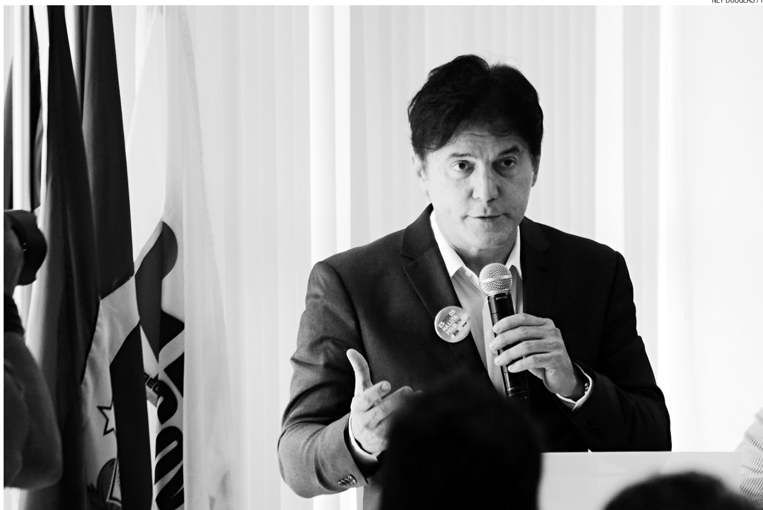
► Lei da Informação era tida como compromisso do governador Robinson Faria, que elegeu a transparência como uma das marcas de seu governo

Algumas informações pertinentes à segurança da sociedade ou do Estado poderão ser classificadas em graus de sigilo. A lei sancionada ontem