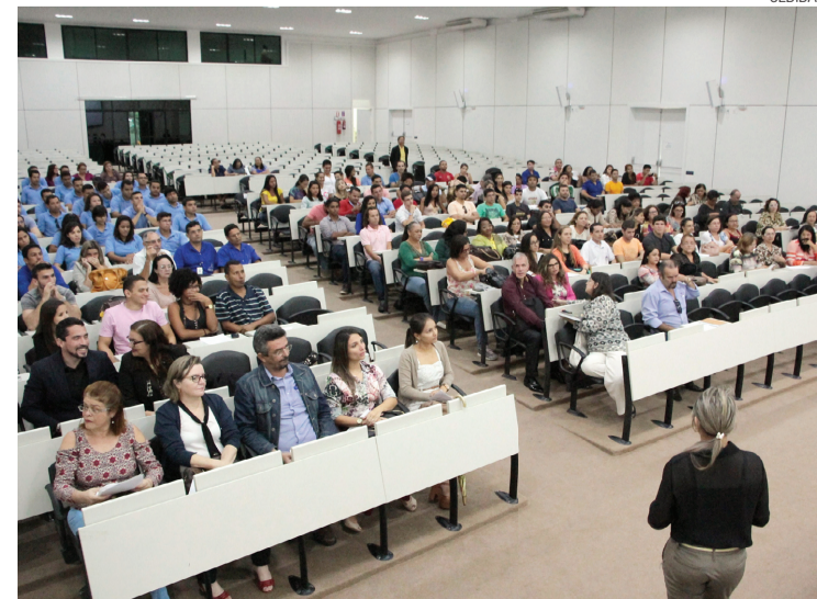
► Agentes comunitários de saúde e de endemia reforçam quadro da saúde