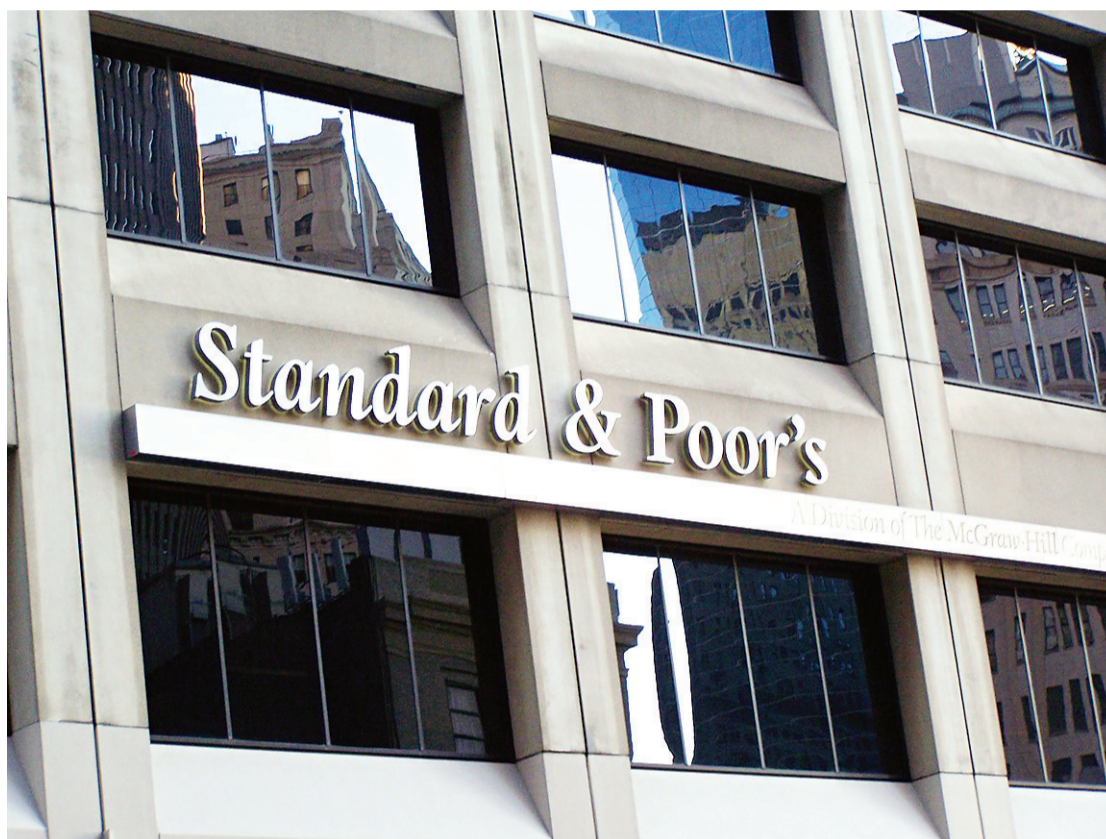
▶ Agência de risco teme "derrapagem" de política econômica e acredita que crescimento firme levará mais tempo

Na avaliação da Standard & Poor's, desde março deste ano, quando houve a última análise, os riscos no país aumentaram. Segundo a agência, no curto prazo, a diminuição da coesão política