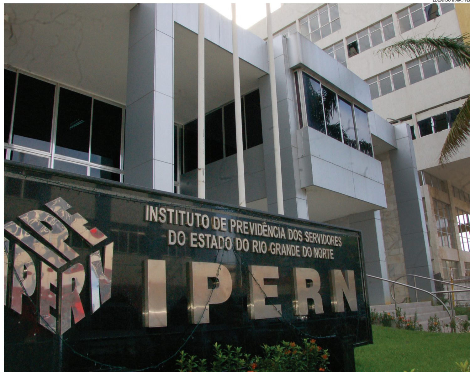
► Instituto de Previdência dos Servidores do Estado do Rio Grande do Norte: alvo de fraudes que estão sendo investigadas pela polícia