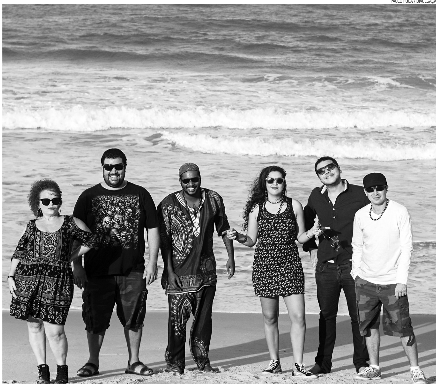
▶ Banda Rosa de Pedra sobe ao palco da Cidade da Criança neste final de semana para a gravação do primeiro DVD ao vivo

Ela frisa ainda que todas as faixas autorais presentes em “Rosa de Pedra” (2007) e “De Maré” (2012), os dois álbuns autorais lançados pela banda até agora, estarão de fora do registro, já que a intenção é mesmo a de priorizar toda a pesquisa popular ainda não gravada pela banda. Em “Cocozurbano” serão 10 cocos de roda especialmente selecionados para a ocasião.