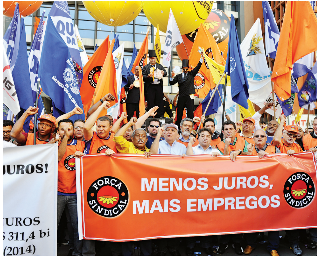
▶ Integrantes da Força Sindical fizeram, ontem, mais um ato em São Paulo contra a elevação da taxa de juros