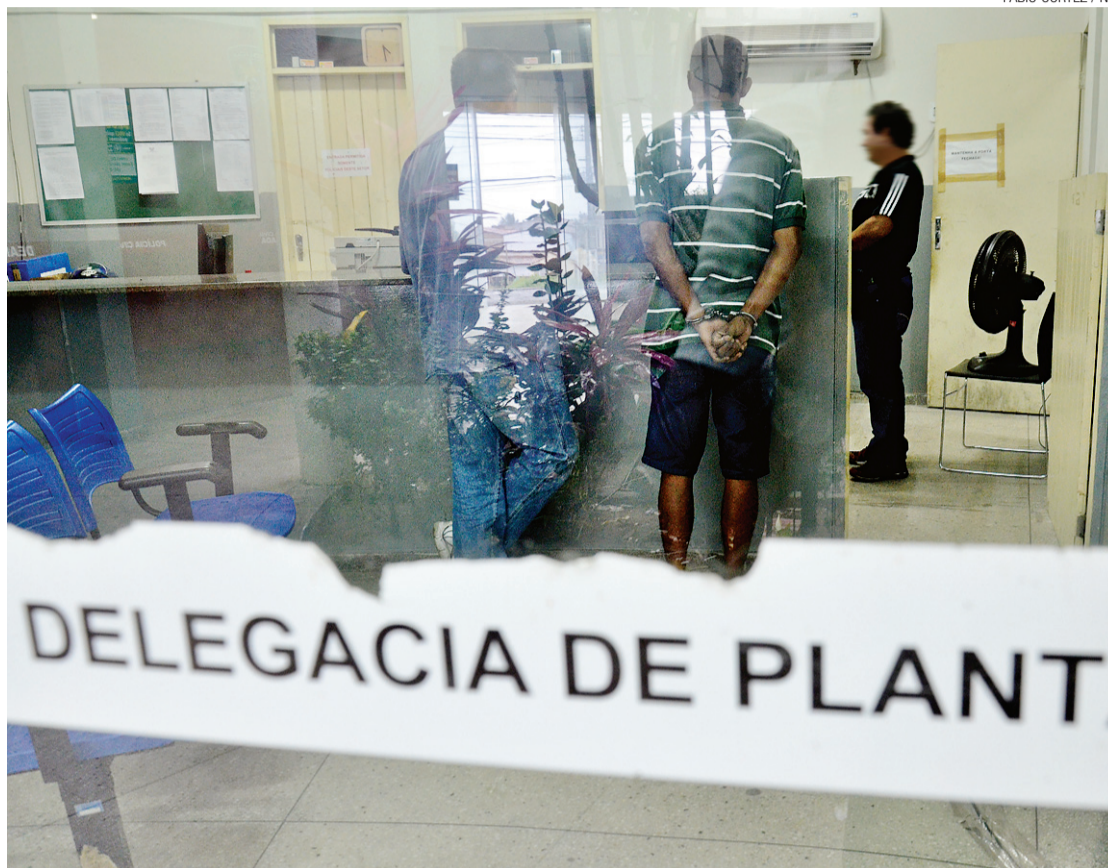
▶ Delegacia de Plantão da Zona Norte: na tarde de ontem, 25 presos estavam custodiados na unidade