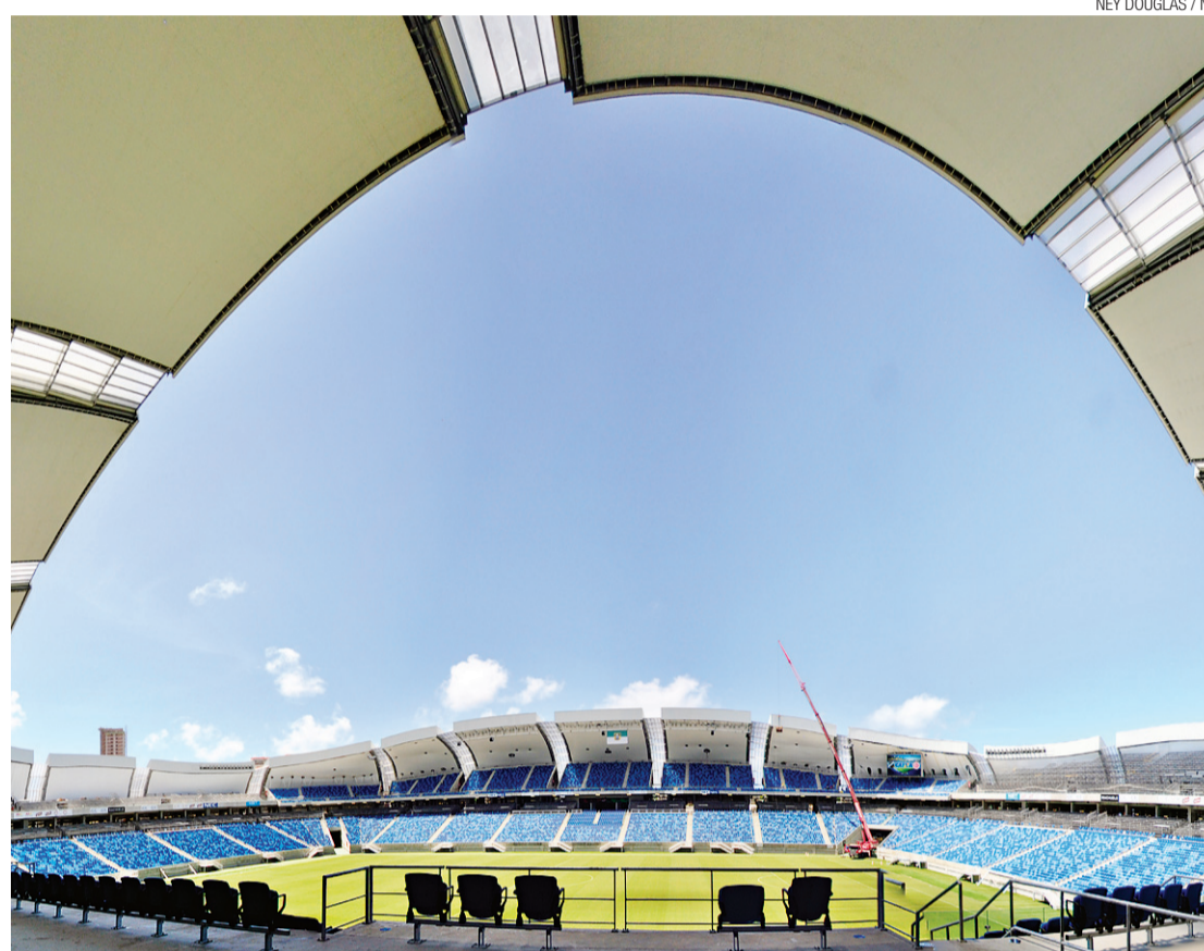
OAS criticou medida e diz que, se não inviabiliza, ela certamente diminui o valor da propriedade dos naming rights