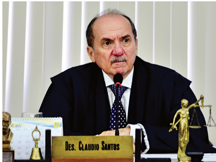
▶ Claudio Santos, presidente do Tribunal de Justiça: apuração

Segundo os dados da Sejuc, o excedente de presos no sistema é de 2.976 presos. Atualmente as vagas das unidades prisionais são ocupadas por 7.637 detentos, quando o número estimado de vagas é de 4.661 apenados.