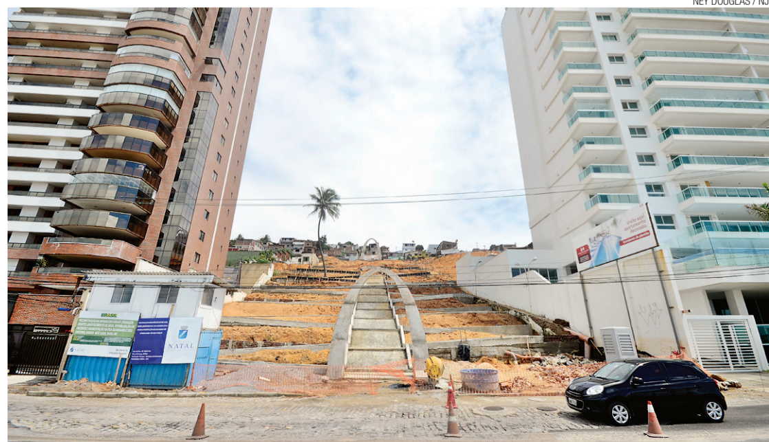
▶ Recuperação da encosta de Mãe Luíza: descontinuidade da obra acarreta riscos no período de chuva

Segundo o secretário, com a reurbanização da rua Guanabara concluída, será possível dar continuidade aos trabalhos de microdrenagem em outras vias do bairro. "Sem o medo de desabamentos ou outros problemas", ressaltou. O projeto de recuperação da Rua Guanabara e construção do muro de arrimo e reurbanização da encosta custará em torno de R$ 5,6 milhões.