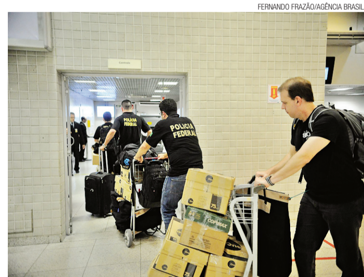
► Polícia Federal recolhendo material na Eletronuclear

Editais - Balanços Avisos - Comunicados Notas - Fúnebres Institucionais - Varejo Encartes