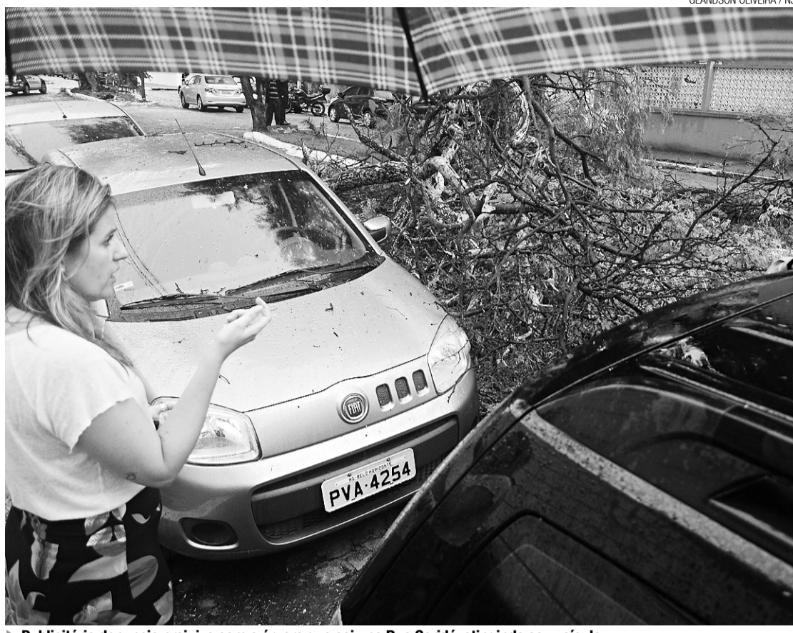
▶ Publicitária denuncia prejuízo com a árvore que caiu na Rua Seridó, atingindo seu veículo

O setor de Arborização trabalha em duas linhas: levantamento e arborização. Na primeira situação é identificado o número de árvores e suas especificidades. A outra ponta é